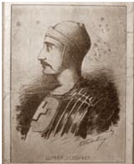
Цар Јован Ненад (1492-1527)

Према опису савременика Цар Јован био је „богомдани вођа народа: оштрог ума, убедљив, енергичан и неуморан, у боју храбар, спрам својих војника строг, спрам непријатеља неумољив“. Мађари су га прозвали „Црним човеком“, због црног белега на лицу.