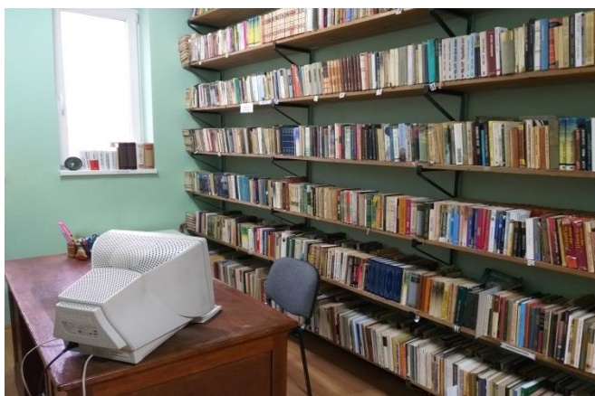
Сл. 1 Огранак Марадик

Данас огранак Библиотеке у Марадику броји 8451 књигу, од тога 1096 књига на мађарском језику.